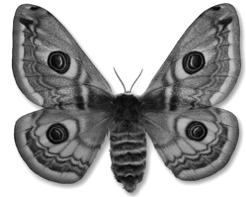
Grote nachtpauwoog ( Saturnia pyri )

Nachtvinders worden vaak afgedaan als de saaie tegenhangers van dagvlinders. Als je eens even de tijd neemt zal je ontdekken dat ze zeker zo schitterend en minstens zo aantrekkelijk kunnen zijn als dagvlinders. Bekijk bijvoorbeeld eens een nachtpauwoog (foto rechts), het dier is prachtig getekend met bruine, blauwe lijnen en vooral opvallend grote felle oogachtige tekeningen op de vleugels. De koperuil, een veelvoorkomende soort uit onze streek welke vaak op licht afkomt, heeft schitterende goudgekleurde patronen op zijn vleugels. De familie van de pijlstaarten binnen de nachtvinders zijn dan weer heel grote vlinders, enkele inheemse soorten kunnen zelfs zo groot worden als een muis!