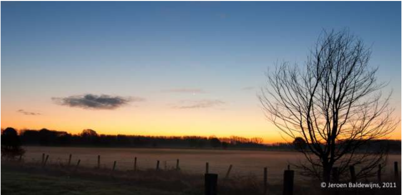
Foto: zicht op het weilandencomplex van de Hoge Scharent.

De VogelWerkGroep van Natuurpunt Haacht zal de broedvogelinventarisatie van 2012 op de Hoge Scharent-net als vorig jaar voor de eerste maal toen – uitvoeren met behulp van de SOVON invoermodule. Het systeem heeft al een lange, uitgebreide en zeer arbeidsintensieve testfase doorlopen in Nederland, en werd vorig jaar voor het eerst gebruikt in Vlaanderen, dus de kans dat er zich nog veel ongemakken of foutjes zullen aandienen, lijkt eerder beperkt.